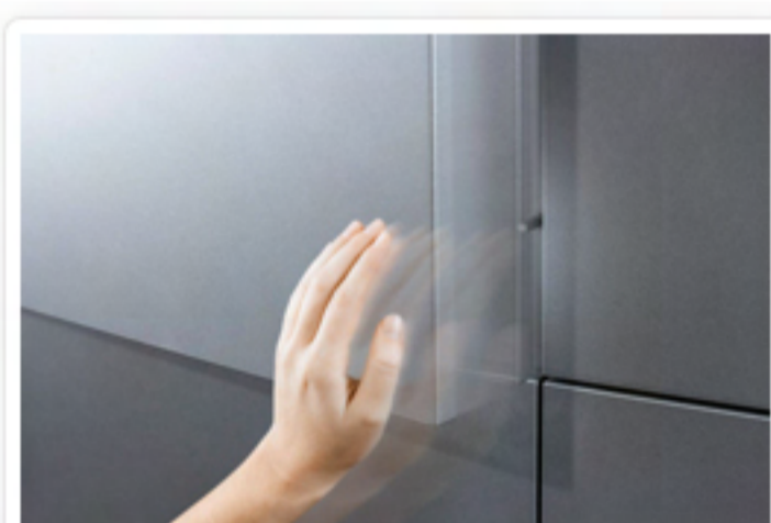
TIP-ON za vrata

Vrata bez ručki se uz pomoć mehanizma TIP-ON otvaraju bez problema - dovoljan je lagani dodir. Pritom se vrata otvaraju u kutu pogodnom za korisnika namještaja. Unutrašnjost ormara je sasvim pregledna i ne ograničava kretanje korisnika namještaja.