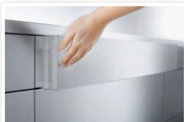
TIP-ON za TANDEMBOX, MOVENTO i TANDEM

Ladice i sustavi na izvlačenje bez ručki mogu se pomoću mehaničke podrške pri otvaranju TIP-ON za TANDEMBOX, odnosno MOVENTO i TANDEM otvoriti jednostavno i pouzdano: Dovoljan je lagani dodir fronte na bilo kojem mjestu. Zahvaljujući opcionalnoj sinkronizaciji, TIP-ON funkcionira i kod širokih izvlačenja. Za zatvaranje je dovoljno lagano pritisnuti frontu.