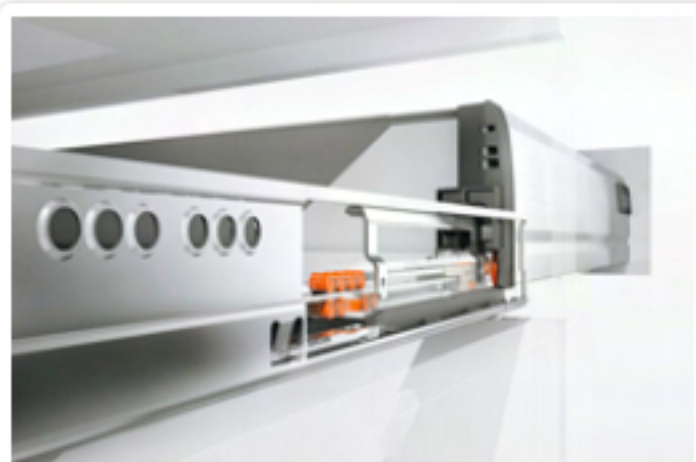
Vodilice koje se pričvršćuju na korpus TANDEMBOX plus BLUMOTION

Bezbroj puta dokazana vodilica koja se pričvršćuje na korpus TANDEMBOX oduševljava laganim klizanjem. Tehnologija BLUMOTION omogućuje nježno i tiho zatvaranje.