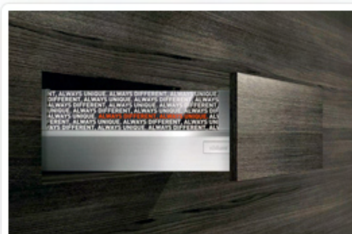
Zatvoren do vrha, a ipak otvoren za sve

TANDEMBOX intivo nudi mogućnost individualnog oblikovanja sustava na izvlačenje. Individualne mogućnosti dizajna daju osobni pečat svakoj kuhinji.